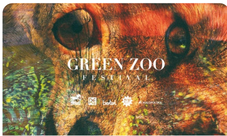
Green ZOO Festival 2017 - Karnet