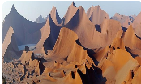
Trawers Slajdownisko: Namibia