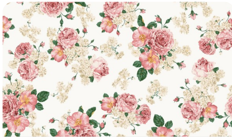
Żywa Lekcja Przyrody - Nie Taki Pająk Straszny!