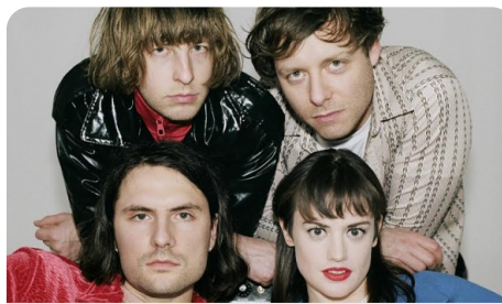
Green ZOO: TOPS (CA) + Rycerzyki (PL)