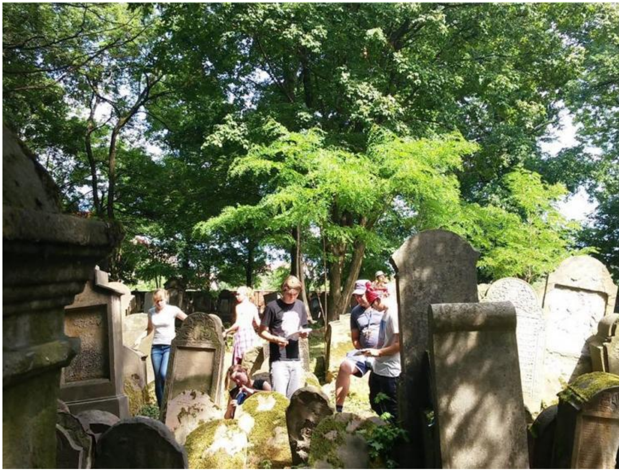
Cmentarz Żydowski w Tarnobrzegu.