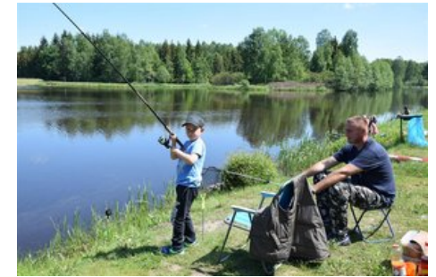
WĘDKARSKI DZIEŃ DZIECKA